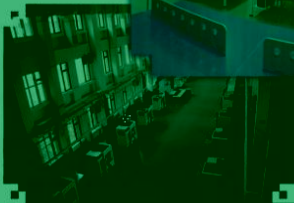
DMC 数控技术 训练场所